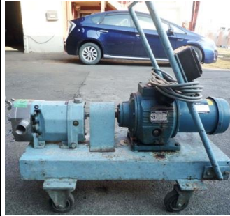
5170 ステンレスポンプ