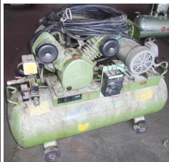
5197 エアーコンプレッサー