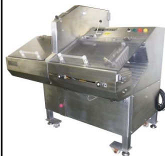
5194 チョップカッター