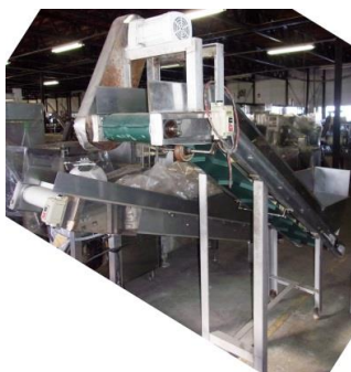
5192 斜めベルトコンベアー (棧付)