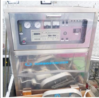
5179 ターボ式オゾンナイザー