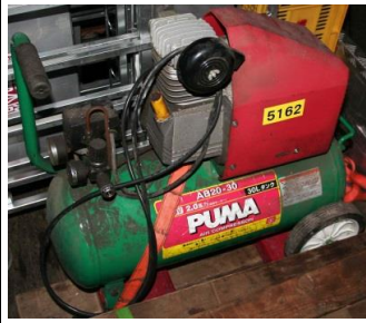
5162 エアーコンプレッサー (1.5kW)