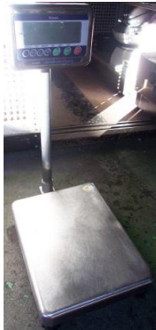
5176 デジタル台はかり