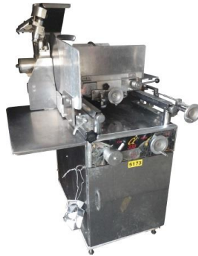
5173 ミートスライサー