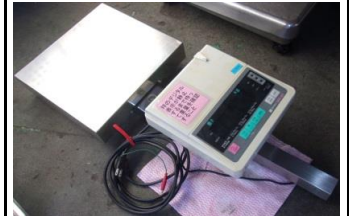
5175 デジタル台はかり