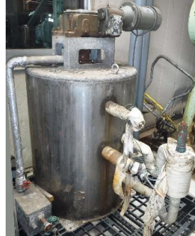
7035 ハウエアイスフレーター (製氷機)