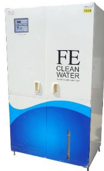
7039 電解次亜水生成装置 (FE clean water)