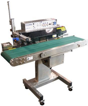
7029 ヨコ型シール機 (パワーシーラー)