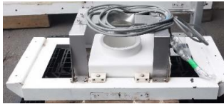
7015 円筒型金属検出機