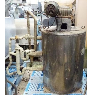
7036 ハウエアイスフレーター (製氷機)