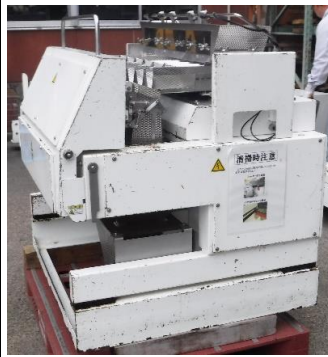
7014 コンピュータスケール