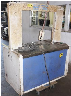
7033 バンド掛け機 (ナイガイ自動梱包機)