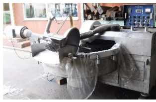
7007 サイレントカッター