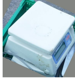
7003 デジタル上皿はかり (両面表示タイプ)