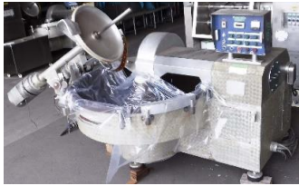
7005 サイレントカッター