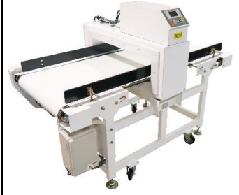
7012 コンベアー式 金属探知機