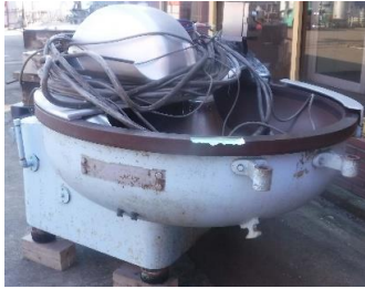
7025 カッター (ビブブレンダー)