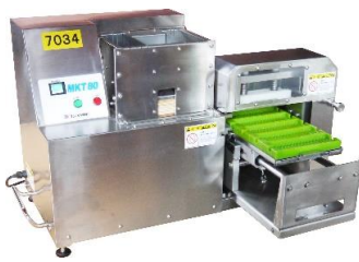
7034 卓上型串刺機 (ちびスケ5)