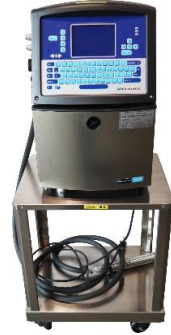
7028 産業用 インクジェットプリンター