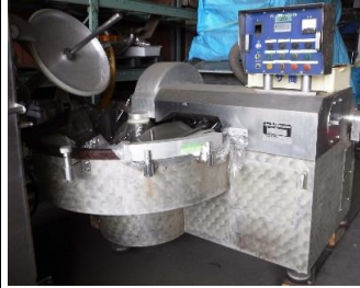
7006 サイレントカッター