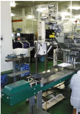
7013 エイジレス投入機