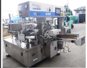
7016 給袋式自動充填包装机