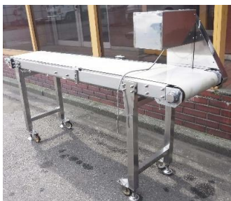
7613 ベルトコンベアー