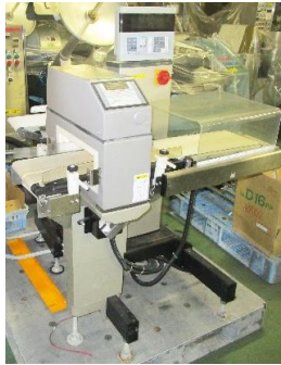
7602 金属検出機付 オートチェッカー