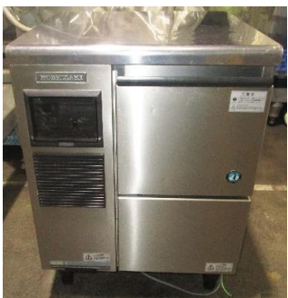
7637 製氷機 (チップアイスメーカー)