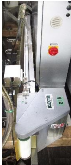
7605 ベルトコンベアー (棧付)(脚なし)