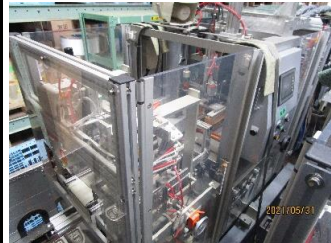
7607 フィルム包装機 (帯掛包装機 タイトパッカー)