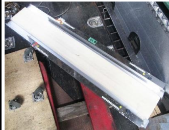
7603 ベルトコンベアー (脚なし)