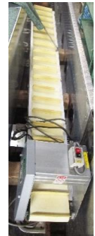
7604 ベルトコンベアー (棧付)(脚なし)