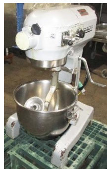
7634 卓上型ミキサー (12コート)