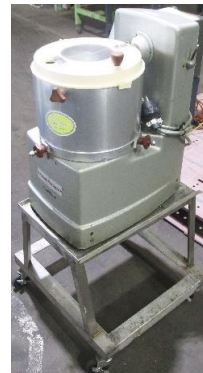
7635 カッターミキサー