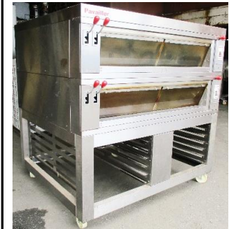
7628 2段式ルビーオープン (万能デッキオープン)