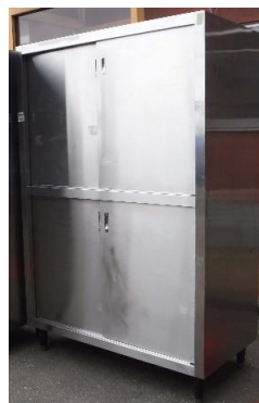
7639 ステンレス引戸収納庫