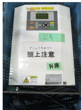
7611 パイプ式金属検出機