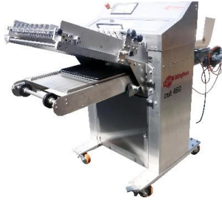
7623 冷凍生地カッター