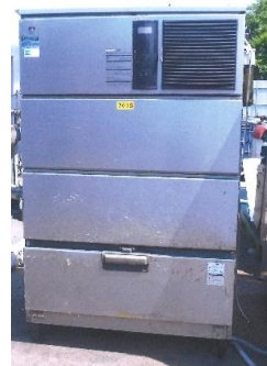
7615 製氷機 (キューブアイスメーカー)