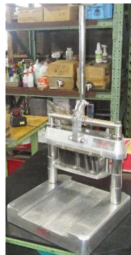
7638 手動式テンドーライザー