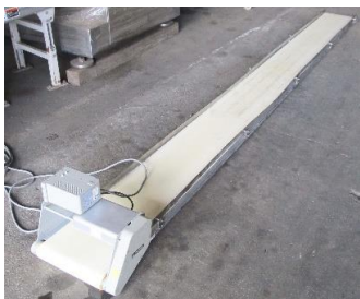
7609 ベルトコンベアー (脚なし)