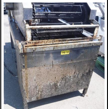
7616 生揚げ用フライヤー