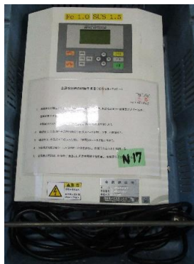
7610 パイプ式金属検出機