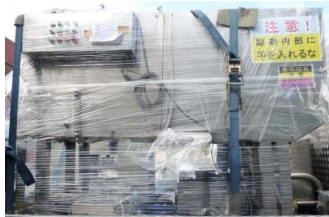
5066 ロータリーカッター