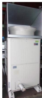
5079 設備用パッケージエアコン (年間冷房用中温用 室外ユニット)