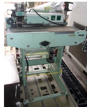
5072 オート・プリンター