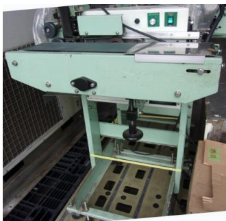
5073 オート・プリンター