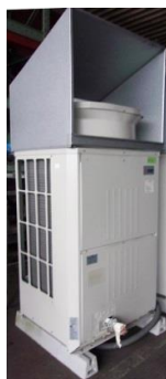
5078 設備用パッケージエアコン (年間冷房用中温用 室外ユニット)