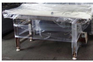
5067 ベルトコンベアー