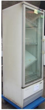
6262 冷蔵ショーケース