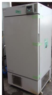
6254 プログラム低温恒温器 (プログラムインキュベーター)