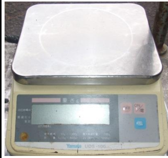
6246 デジタル式上皿自動秤