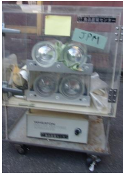
6261 卓上型 ローラー培養装置