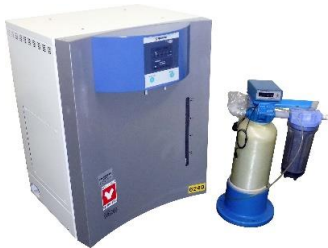
6249 純水製造装置 オートスチル