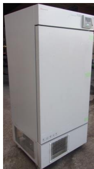
6253 プログラム低温恒温器 (プログラムインキュベーター)