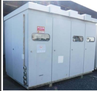
6727 キュービクル式 高圧受電設備