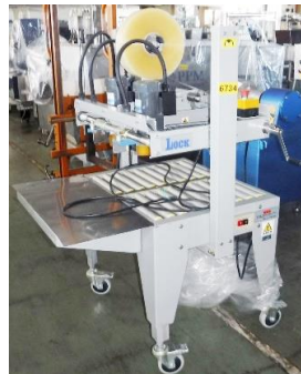
6734 封函機 (ケースボーイC型)