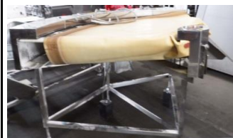
6739 カーブベルトコンベアー