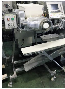
6723 メロンパン用 ビス生地デポジター