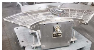
6738 ネットカーブコンベアー