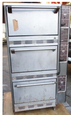
6758 炊飯器(立体ガス式)