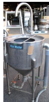
6756 水圧洗米機 (Rice Washer)