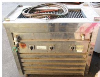
6747 電気グリラー (万能型タイプ 床置型)