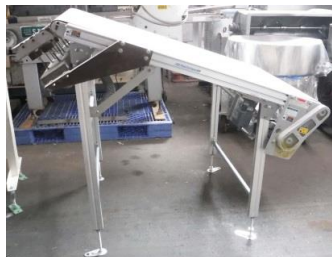
6741 斜めネットコンベアー