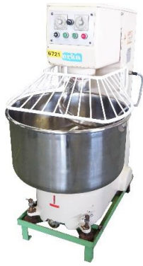
6721 スパイラルミキサー